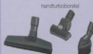
wand- en meubelmondstuk plumeau- mondstuk

De Sebo Felix met electroborstel is primair een stofzuiger voor het optimaal zuigen van tapijt. Daarnaast kunnen ook bijvoorbeeld plavuizen gezogen worden met de electroborstel. Voor het zuigen van parket of laminaat bevelen wij een Sebo parketborstel aan. Deze speciale parketborstel is voorzien van dubbel gelagerde rubberwielens zodat er geen beschadigingen aan de vloer kunnen ontstaan.