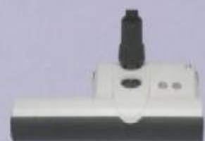
Felix 2: 37 cm werkbreedte