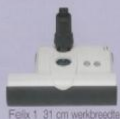
Felix 1: 31 cm werkbreedte

Door dit drievoudige filtersysteem voldoet de uitblaasluicht van de Sebo Felix aan de "S-klasse" normering. Dit maakt de Sebo Felix tevens bijzonder geschikt voor mensen met een stofallergie.